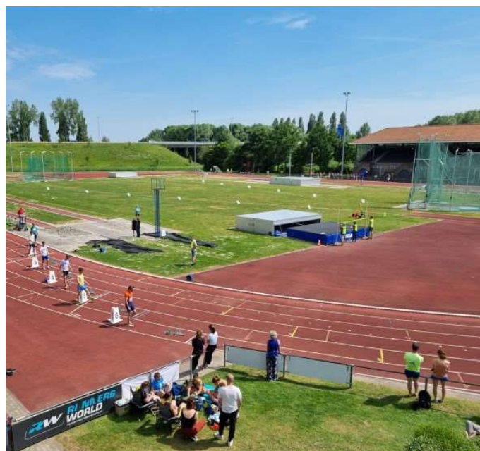
Competitie op eigen baan, altijd bijzonder; start 400 m.

Bij de vrouwen was Cristy Pieter (MJB) in 13,06 s de snelste op de met tegenwind gelopen 100 m. Anniek de Lange (MJB) won in 26,82 s de 200 meter en haalde de nodige punten binnen met 1,70 m hoog. Claudia Noordzij deed in 64,11 s op de 400 meter wat van haar verwacht werd. Tessel Mingaars liep de 800 meter in een nette 2:40,33. Voor de langere afstanden was de temperatuur wat aan de hoge kant, maar desondanks liep Anna van Stigt de 3000 meter in 11:44,80. De 4 × 100 m estafetteploeg demonstreerde de suprematie van Fortius . Startloopster Ilse Torbijn nam al meteen een voorsprong, die vervolgens door Milet Hoornaar, Savannah Bailey en tenslotte Cristy Pieter steeds verder werd uitgebouwd. Het team finishte met een straatlengte voorsprong in 50,22, een tijd die zelfs in de eredivisie niet zou misstaan.