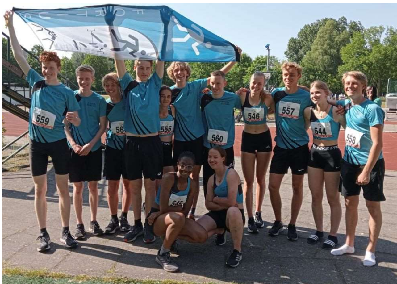
De ploeg die in Alphen a/d Rijn aan de start stond.