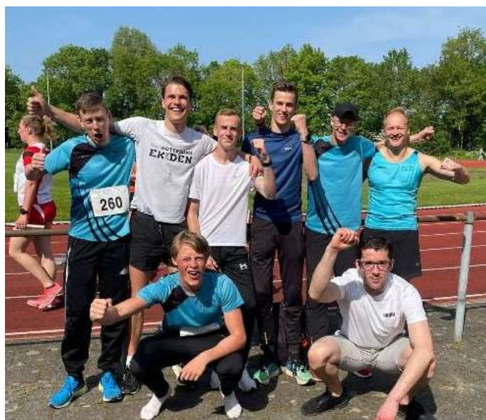
De mannen competitieploeg.