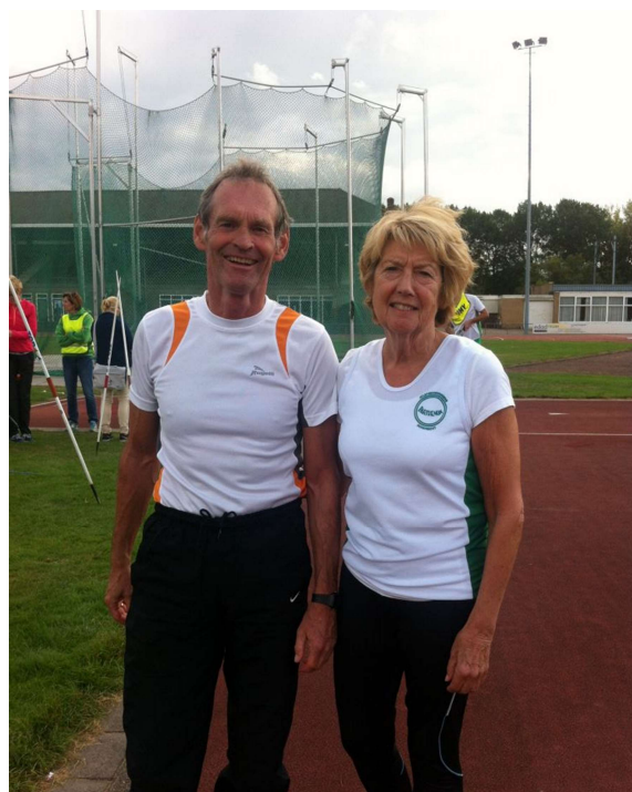
Ko en Wil op de thuisbaan in Dordrecht.