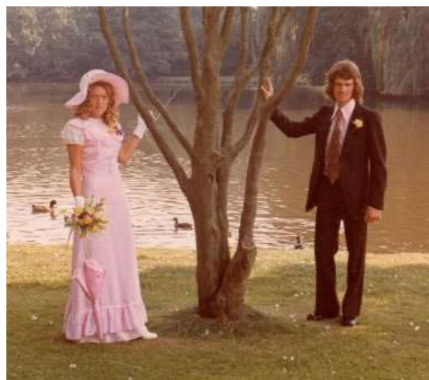
Een atletiekhuwelijk uit de jaren '70.