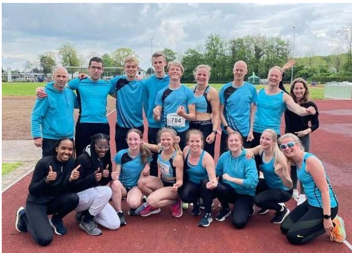
De Fortius senioren ploegen tijdens de eerste competitiewedstrijd van 2023 in Hulst.

Twee busjes vol atleten vertrokken zondag 7 mei vanuit Dordrecht naar het in Zeeuws-Vlaanderen gelegen Hulst voor de eerste wedstrijd in de seniorencompetitie. Bij aankomst daar troffen ze een vierbaans rondbaan aan, wat een van de Fortius deelneemsters de uitroep 'Wat een schattig baantje!' ontlokte. Wel stond er een modern clubgebouw langs de baan, waren er twee EDM's beschikbaar voor de werpnummers, werkte de ET vlekkeloos en leek de organisatie geen moeite te hebben gehad met het vinden van vrijwilligers. Kortom: alles dik in orde. Zelfs het weer werkte mee. Tijdens de eerste onderdelen viel er nog wat lichte regen, maar daarna bleef hij tegen de verwachtingen in heel de dag droog.