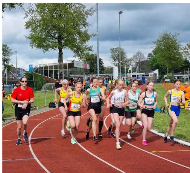
Novi Hermus (905) is zojuist gestart op de 3000 m.

De acht teams die na drie voorrondes bovenaan staan in de 3 e divisie, mogen in september naar de promotie/degradatie-wedstrijd. Die acht teams worden aangevuld met de onderste vier ploegen uit de 2 de divisie. De inzet is promotie naar de 2 de divisie of – voor de teams uit de 2 de divisie – degradatie naar de 3 de divisie.