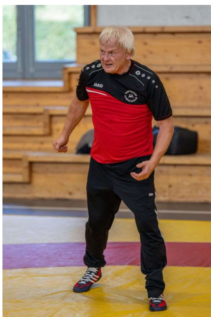
Fons Eijsackers op de mat.

Op 29 oktober werd ter gelegenheid van de verhuizing van de Worstelafdeling naar de Fortiushal een Masterclass worstelen gegeven door de Belgisch oud-international en kampioen Worstelen Fons Eijsackers. Daarvan is een foto-impressie gemaakt, waaruit hieronder een selectie. Alle foto's zijn te vinden en te downloaden via de volgende (tijdelijke) link (tussen 24:00 en 8:00 uur is er geen servertoegang): https://os5.mycloud.com/action/share/1cab9988-e42e-4bc4-95b3-43e8be4330cb Graag hadden wij hier ook een interview met een van de worstelaars afgedrukt, maar dat bleek helaas op deze termijn niet meer mogelijk, hopelijk later.