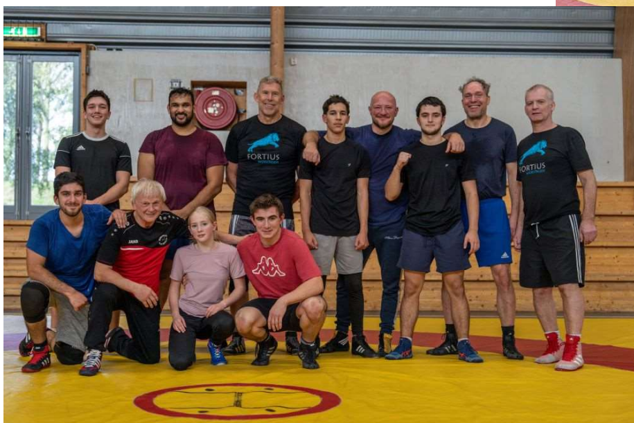
De complete groep aanwezige Fortius worstelaars.