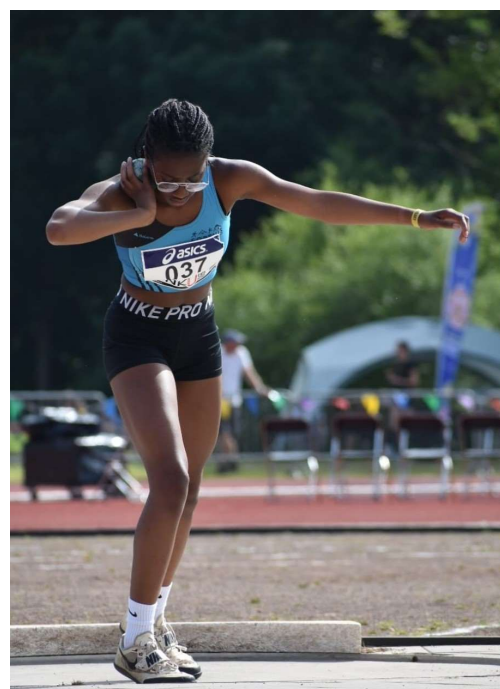
Kogelstoten tijdens de NK outdoor 2022, waarop ze tiende werd.