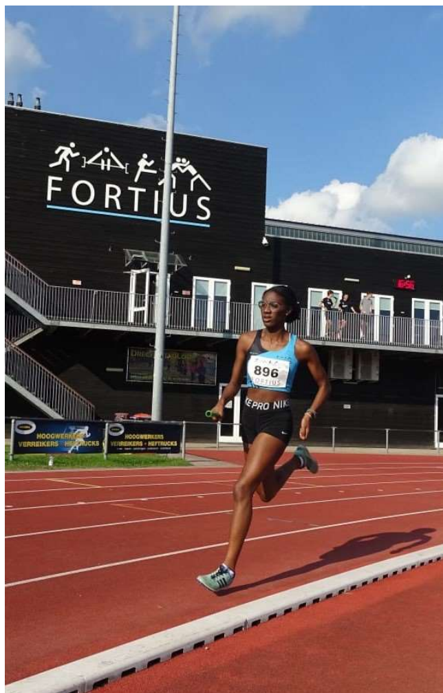
Tijdens een thuiswedstrijd op de 4x400 m estafette voor de seniorencompetitieploeg in 2022.