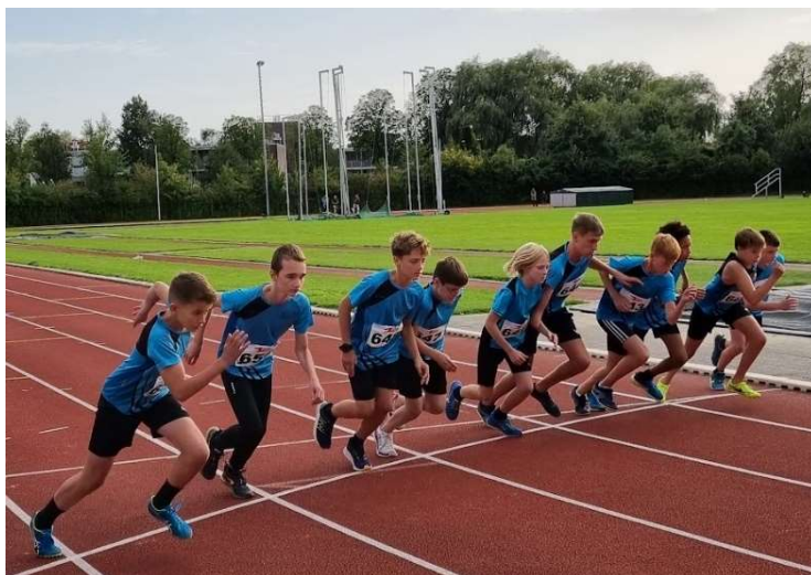
Start van de 1000 m Jongens Junioren D.

Op Atletiek.nu zijn de uitslagen van de clubkampioenschappen te vinden.