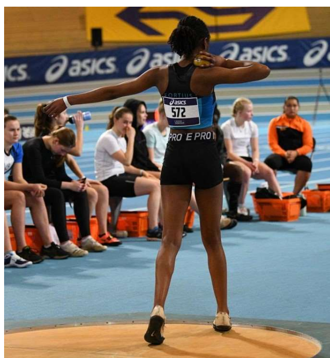
Kogelstoten op de NK indoor in 2022.