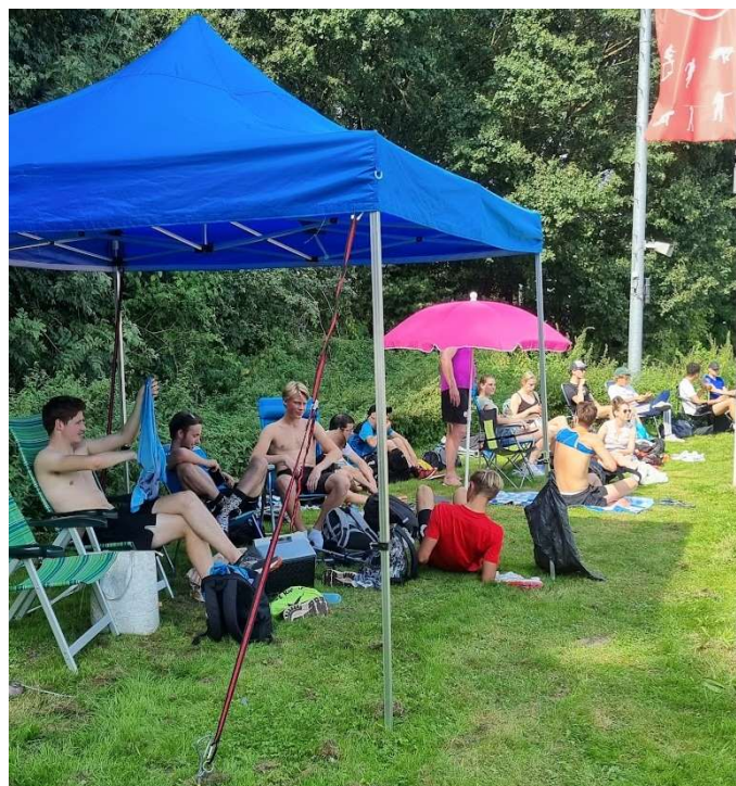
Een dak om je te beschermen tegen de felle zon was tijdens de competitiefinale geen overbodige luxe.