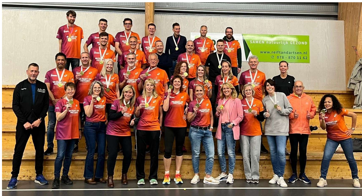
Een groot deel van de lopers uit Fortius marathongroep, die succes waren tijdens de Rotterdam Marathon 2024.